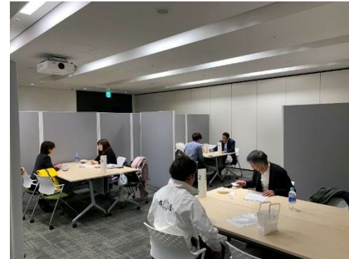
個別商談会(対面)の様子