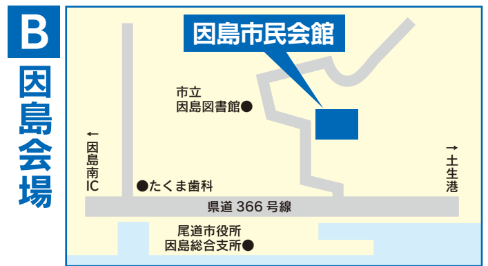
尾道市因島土生町 88-1 TEL:0845-22-6565