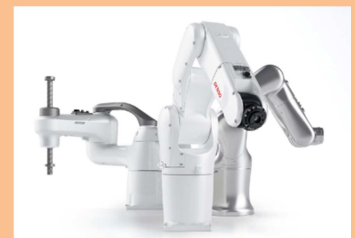
▲(株)デンソーウェーブ製品